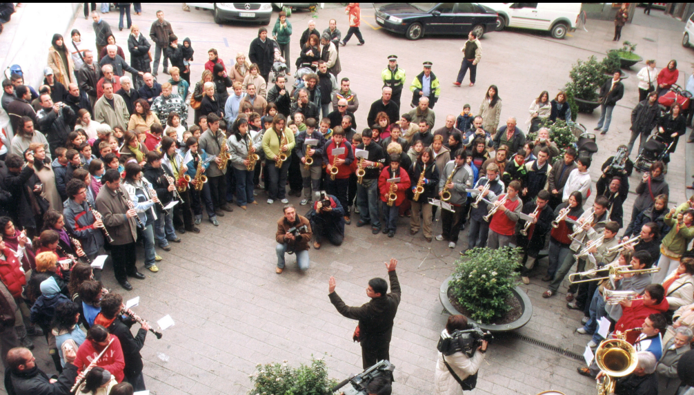
Interpretació del Ball de l'Àliga per tal de donar a conèixer a la població la resolució de la UNESCO (Foto Luigi. Arxiu Comarcal del Berguedà).