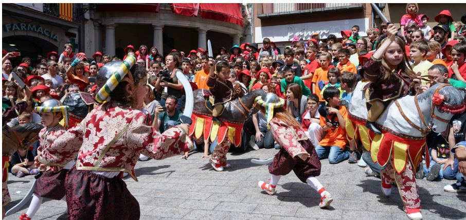
La Patum infantil fou un dels elements considerats clau pel jurat per assegurar la transmissió de la festa (Foto Luigi. Arxiu Patronat Municipal de La Patum).

Tres elements clau també van ser el Patronat Municipal de La Patum, creat recentment - i que en aquell moment era un organisme autònom local -, ens que va entomar el repte amb força i il·lusió i va esdevenir garant de la tradició (element indispensable segons la UNESCO per obtenir el reconeixement).