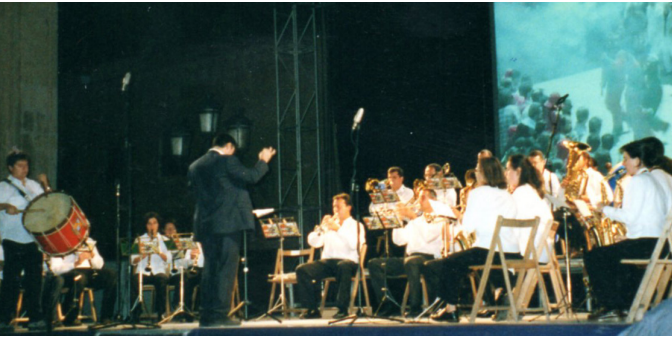
Concert de música de La Patum al Festival de Teatre i Música Medieval d'Elx el 26/X/2002 (Foto Albert Rumbo).

Finalment, el Misteri d'Elx va ser declarat Obra Mestra del Patrimoni Oral i Immaterial de la Humanitat per la UNESCO el 18 de maig de 2001. Aquell any, l'organisme internacional va reconèixer 19 celebracions d'un total de 32 candidatures